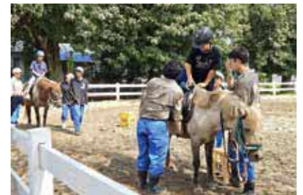
▲あぐりキッズスクール（乗馬）

目指した青パパイヤ栽培の研究を継続しています。生物科では1年生の1年間は全員が祥雲寮に入寮し、文字通り「同じ釜の飯を食べて」農業の基礎・基本を学んでいます。