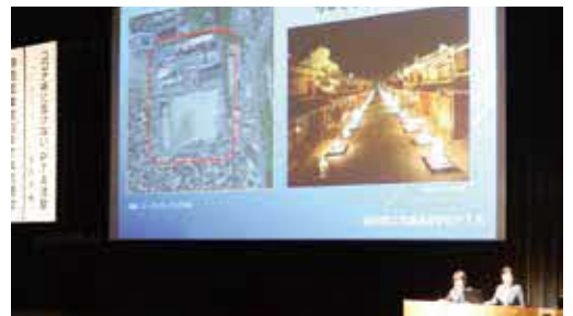
▲研究協議（岐阜県立武義高校）

その後、研究協議を行い、岐阜県立武義高校PTAが『コロナ禍に負けない、PTA活動』、静岡県立静岡農業高校PTAが『静岡農業高校PTAの活動』というそれぞれのテーマで発表を行いました。