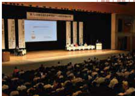
▲各県代表による研究協議