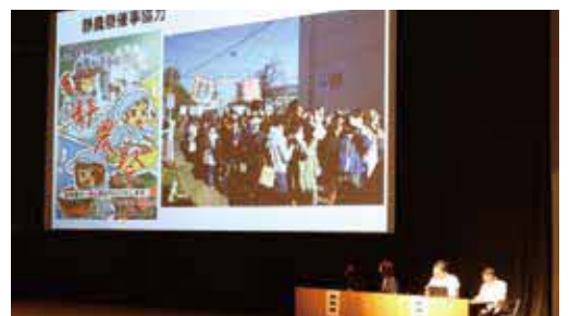
▲研究協議（静岡県立静岡農業高校）

武義高校は、学校名の由来から始まり、保護者大学見学会、学校祭緑日、PTA就職面接指導、挨拶運動・交通安全指導など、コロナ禍で制限されましたが工夫してPTA活動をされたことが紹介されました。このようにPTA役員として前向きに学校と関わることで一