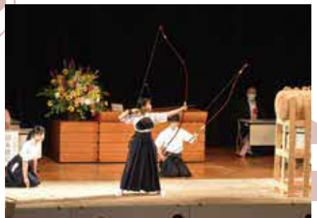
▲大会の成功を予祝する「巻藁射礼」