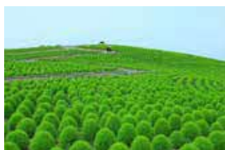
国営ひたち海浜公園